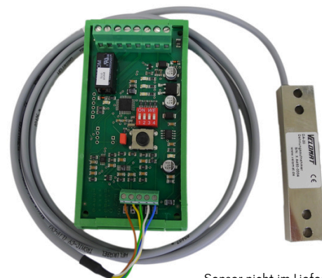
Sensor nicht im Lieferumfang inbegriffen